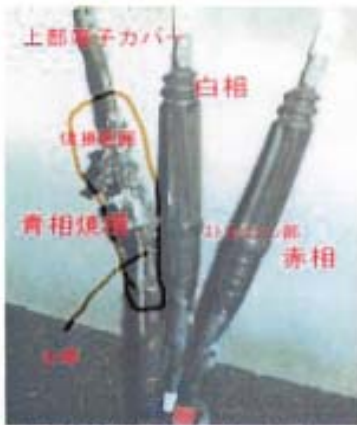
落雷により焼損したケーブル