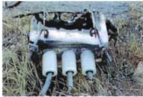
落雷による損壊 開閉器